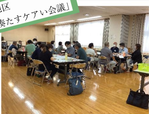
湊地区 「湊たすケアい会議」