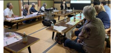
meiji 乳業を講師に勉強しました