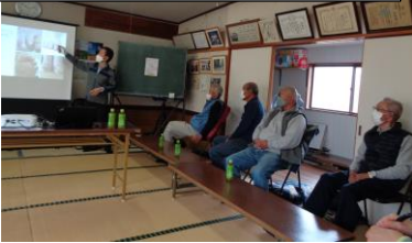
出前講座で「足」について勉強