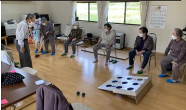
道具を借りてレクリエーション